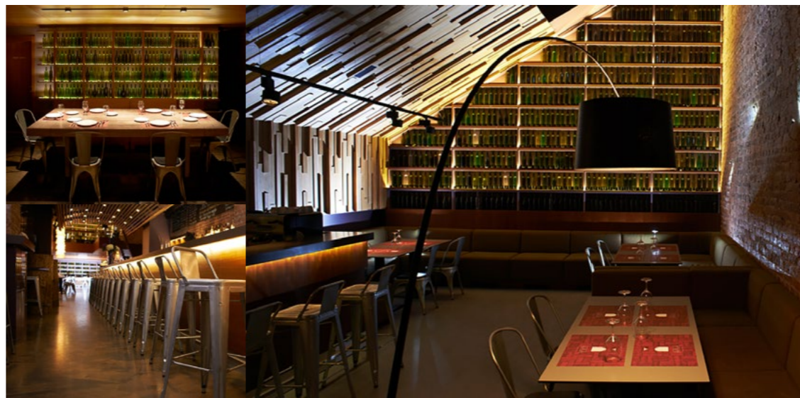
Ресторан ARKA (Санкт-Петербург).

В последние три-четыре года в ресторанном бизнесе появилось очень много хороших интерьеров. Если раньше в городе было лишь несколько грамотных специали-