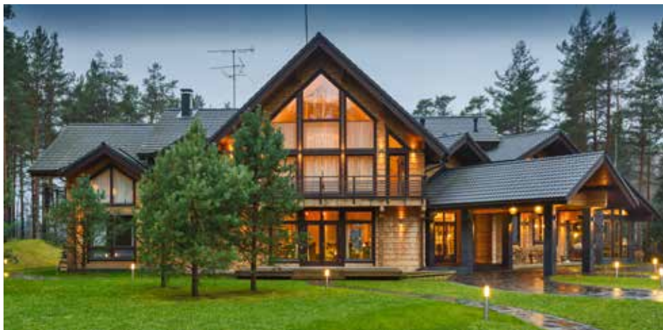
Слева и сверху: Частный дом в поселке «Медное озеро», Ленинградская область. Архитекторы: Вячеслав Хомутов (Naubaus), Ирина Заварина (Honka). Строительство: Honka Russia.

Нет любимого проекта, они все мне дороги. Ведь каждый проект ты создаешь с нуля и «растишь»