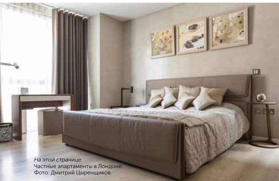
На этой странице: Частные апартаменты в Лондоне.