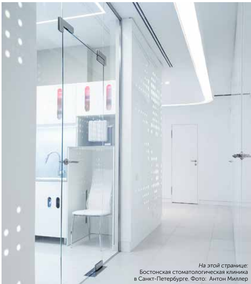
На этой странице: Бостонская стоматологическая клиника в Санкт-Петербурге.

Основной акцент в части ресепшн берет на себя большая грушевидная люстра, состоящая из множества отдельных элементов. Вокруг ее оси располагаются кресла индивидуального изготовления. Монотонность белой стены нарушается светодиодной подсветкой